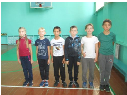
1 место – 4 класс

В октябре в нашей школе прошли соревнования по пионерболу в двух возрастных группах. Среди 2-4 и 5-7 классов. По волейболу среди 8-11 классов. Увлекательно и азартно прошли все игры. Вот они победители соревнований.