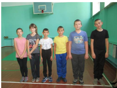
1 место – 5 класс