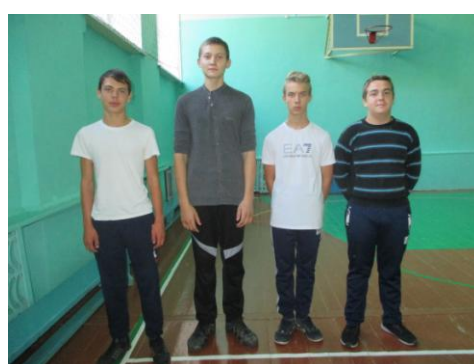
3 место – 8 класс