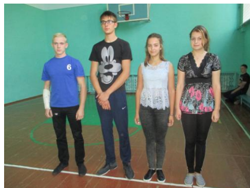
2 место – 10 класс