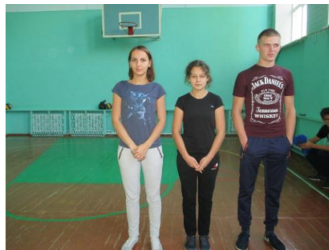
1 место – 11 класс