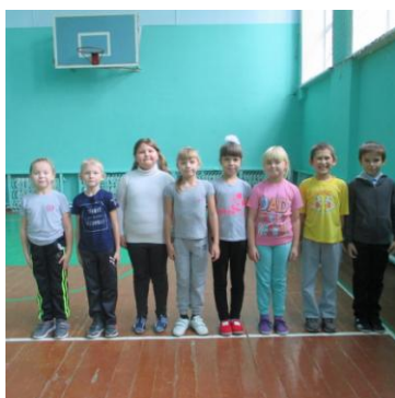
3 место – 2 класс