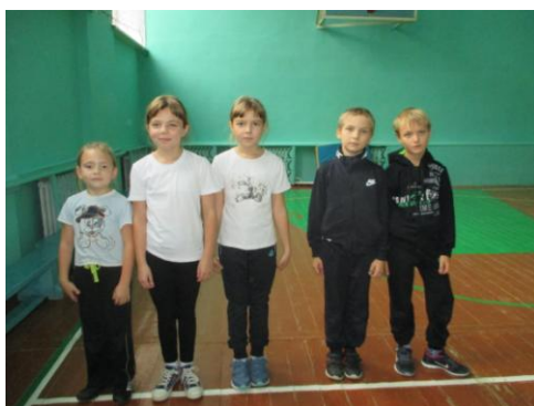
2 место – 3 класс